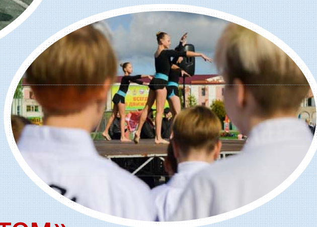
«Друзи со спортом»