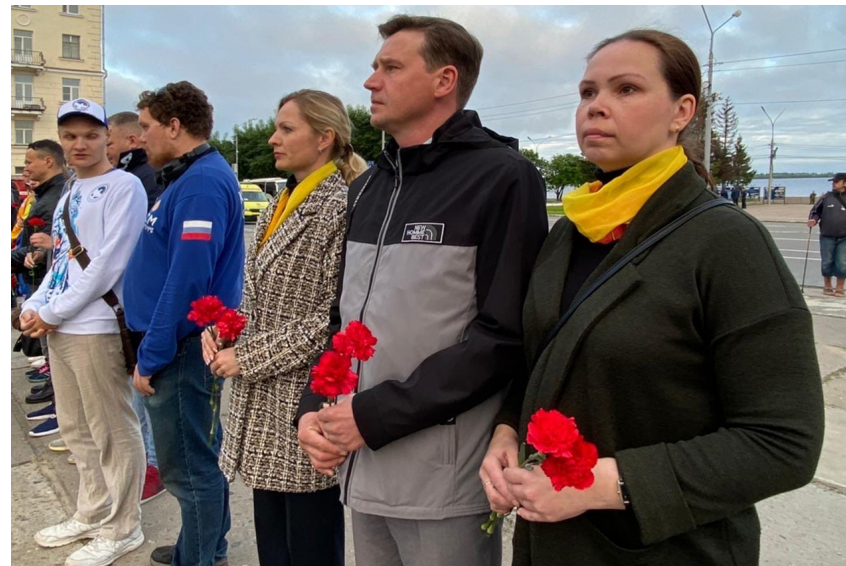
С однопартийцами на акции «Свеча памяти» 22 июня 2022 года

Депутатами фракции 8 июля 2022 года внесен проект постановления №пп7/583 «Об обращении Архангельского областного Собрания депутатов к Министру труда и социальной защиты Российской Федерации Котякову А.О. по вопросу совершенствования механизма поддержки семей, воспитывающих детей», согласно которому предлагалось рассмотреть возможность исключения требования в части однократности предоставления ежемесячной денежной выплаты в размере определенного в субъекте Российской Федерации прожиточного минимума для детей, назначаемой в случае рождения после 31 декабря 2012 года третьего ребенка или последующих детей до достижения ребенком возраста трех лет. Проект постановления снят с рассмотрения в связи с внесением Губернатором Архангельской области законопроекта «О проекте областного закона № пз7/854 «О внесении изменений