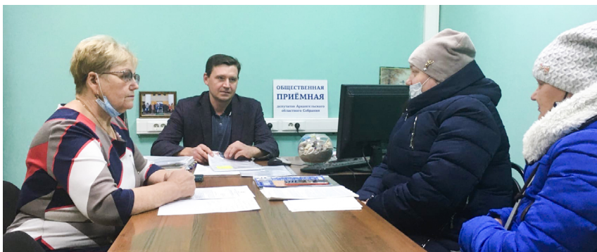
Встреча в общественной приемной с представителями дома по ул. Правды, 15, фл. 1