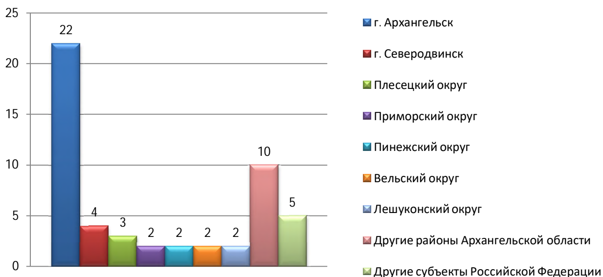
Рисунок 2. Распределение обращений по территориальному признаку

26 обращений поступили в областное Собрание без указания места жительства заявителя.