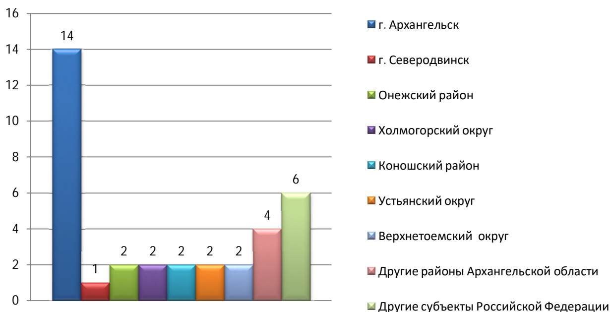
Рисунок 2. Распределение обращений по территориальному признаку

44 обращения поступило в областное Собрание без указания места жительства заявителя.