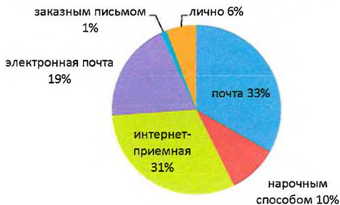
Рисунок 2. Структура обращений по способу доставки

Письменные обращения поступали в 2019 году непосредственно от авторов обращений, через ФГУП «Почта России», электронную почту областного Собрания ( duma@aosd.ru ), официальный сайт областного Собрания посредством интерактивной страницы «Интернет-приемная», а также при помощи курьера или посредника (нарочным способом).